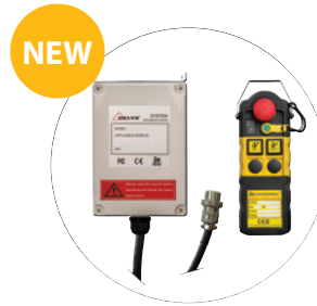
plug & play afstandsbediening / plug & play remote control