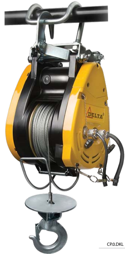
KARWEILIER® MINI WINCH®